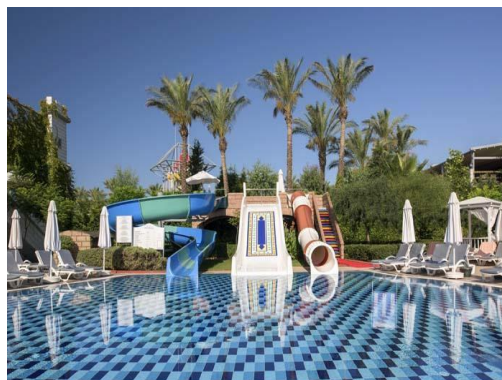
Pool mit Rutschen