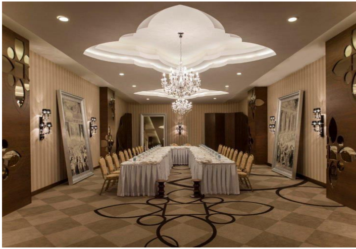
U – Form