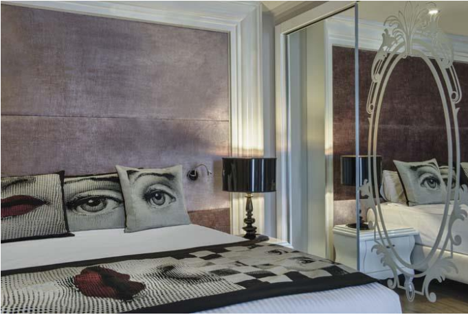
Suite Yatak Odası

Lagoon Oda: Toplam 21 oda, 36 m 2 , bu odalarımızda sadece Lagoon Odalarda kalan misafirlerimizin kullanabileceği genel bir havuz mevcuttur. 1 çift kişilik yatak ve 1 tek kişilik yatak bulunmaktadır. Duş/WC, klima (merkezi belirli saatler arasında), saç kurutma makinası, direkt telefon, LCD televizyon (uydu yayını), müzik yayını, kasa, mini bar, zemin Laminant, kettle, çay, kahve, kahve makinesi bulunmaktadır. Her gün oda temizliği yapılmakta olup, havlular her gün değiştirilmekte, çarşafklar ise 2 günde 1 değiştirilmektedir. Güvenlik açısından 7 yaş altındaki çocukların Lagoon odada kalması uygun değildir. Odalar Deniz tarafı ve giriş katta bulunmaktadır.(Konaklama şekli maksimum: 2 yetişkin + 1 çocuk (7 yaş ve üzeri) veya 3 yetişkin).