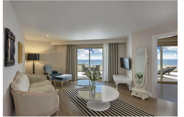
Suite Oturma Odası

Suite: Toplam 2 oda, 58 m 2 , 1 yatak odası (1 çift kişilik yatak), 1 oturma odası, 1 banyo ve terastan oluşmaktadır. Jakuzi terasta bulunmaktadır. Odalarda duş/WC, klima (merkezi, belirli saatler arasında), saç kurutma makinası, direkt telefon, LCD televizyon (uydu yayını), müzik yayını, kasa, mini bar, zemin Laminant, kettle, çay ve kahve bulunmaktadır. Her gün oda temizliği yapılmakta olup, havlular her gün değiştirilmekte, çarşafklar ise 2 günde 1 değiştirilmektedir. Suite odalar Deniz tarafındadır. (Konaklama şekli maksimum: 2 yetişkin)