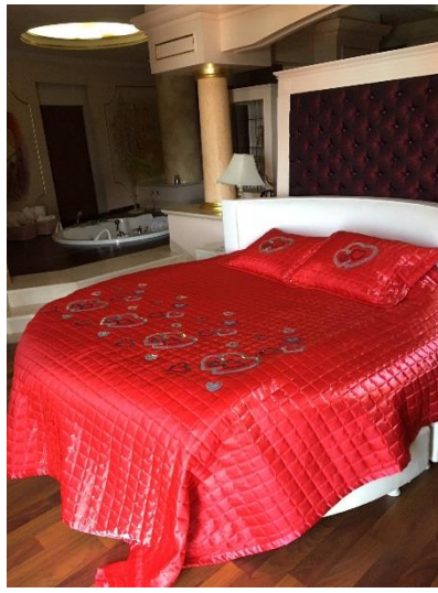
Pink Moon Suite

Pink Moon Suite (80 m 2 ): für Hochzeitspaare; ein rosa eingerichteter runder Raum mit Schlafzimmer für 2 Personen, Speisebereich, Klimaanlage (zentral + stundenweise), Haartrockner, Direktwahltelefon, LCD TV (Satelliten- und Musikempfang), Safe, Mini Bar, Laminatboden, Wasserkocher, Tee, Kaffee und Kaffeemaschine. Jeden Tag Zimmerreinigung und Wechsel von Badetuch. Wechsel von Bettlaken jeden zweiten Tag einmal, Jacuzzi, Dusche / WC, Panorama Fenster mit Meerblick, kein Balkon. Maximale Unterkunft Kapazität: 2 Erwachsene.