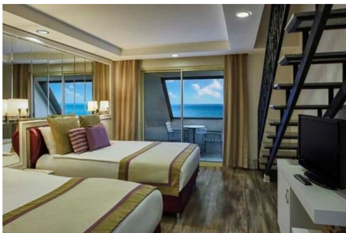
Duplex Familien Zimmer Untergeschoss

Behindertengerechte Zimmer (26 m 2 ): wie die Standard Zimmer eingerichtet, Lage: in der Lobby Etage. Es gibt eine Notruftaste. Technische Details: die Tür: 93 cm, Balkontür: 60 cm, die Aufzugstür: 90 cm, Badezimmertür: 93 cm, Waschbecken Höhe: 81 cm, WC Höhe: 50 cm (Unterkunft: 2 Erwachsene), die Rezeption, Restaurants, Pools und der Strand sind mit dem Rollstuhl möglich zu erreichen. Maximale Unterkunft Kapazität: 2 Erwachsene.