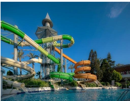
Pool mit Rutschen