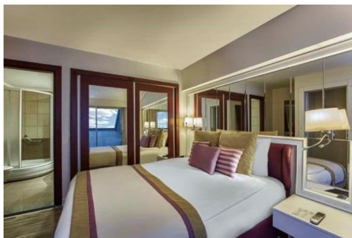
Duplex Familien Zimmer Obergeschoss

Duplex Familienzimmer (47 m 2 ): 2 Schlafzimmer, 1. Etage: 1 Frenchbett + Einzelbett (Dusche / WC), 2. Etage: 1 Frenchbett (Dusche / WC), Klimaanlage (zentral + stundenweise), Haartrockner, Direktwahltelefon, LCD TV (Satelliten – und Musikempfang), Safe, Balkon, Minibar, Laminatboden, Wasserkocher, Tee und Kaffee. Jeden Tag Zimmerreinigung und Wechsel von Badetuch. Wechsel von Bettlaken jeden zweiten Tag einmal, (Unterkunft: 3 Erwachsene + 2 Kinder oder 4 Erwachsene + 1 Kind).