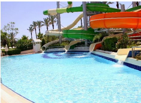
Pool mit Rutschen