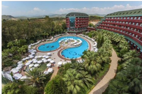
Pool 1 (Relax Pool)