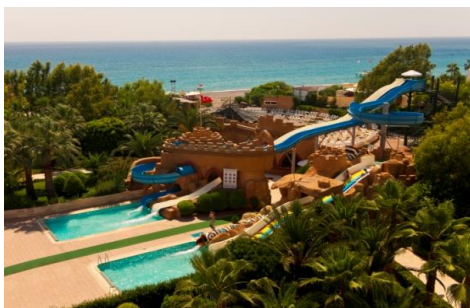
Wasserrutschen Pool 1 und 2