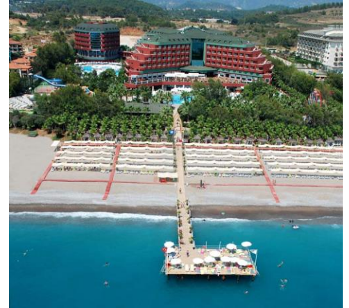
Hauptgebäude und Nebengebäude