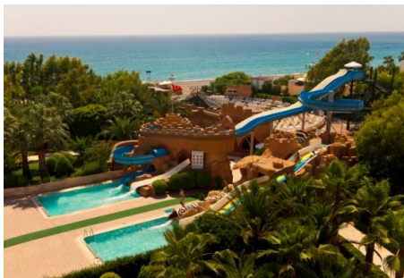
Wasserrutschen Pool 1 und 2