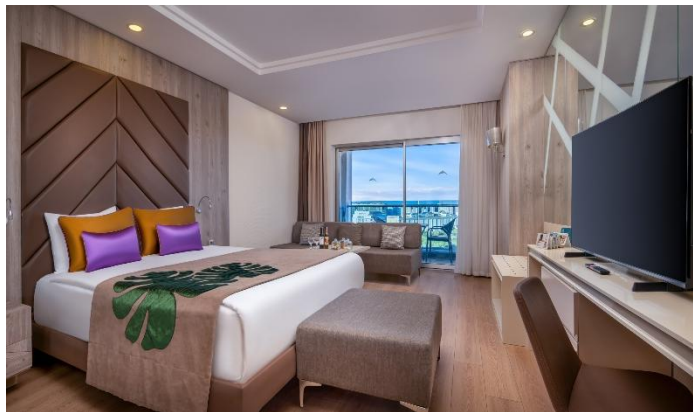
BE Family A