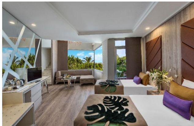
BE Family Loft

BE FAMILY A: insgesamt 110 Zimmer, jedes Familienzimmer ist 56 m 2 und besteht aus 2 Zimmer. Im Elternzimmer gibt es 1 Frenchbett, 1 Sofa, Im Kinderzimmer gibt es 2 Singlebetten (Maximale Unterkunft 4+1 oder 3+2). Die Zimmer verfügen über Balkon, 1 Dusche / WC, Klimaanlage (zentral und stundenweise), Haartrockner, Direktwahltelefon, LCD Fernsehen (Sat Empfang), Musikempfang, Safe, Minibar, Laminatboden, Wasserkocher, Tee und Kaffee. Jeden Tag Zimmerreinigung und Wechsel von Badetuch. Wechsel von Bettlaken jeden zweiten Tag einmal. Zimmerlage als seitlicher Meerblick. Schlafsofa: 160x80 cm.