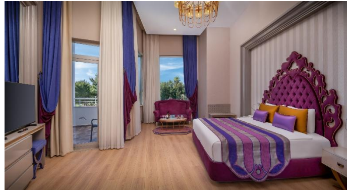
BE Deluxe Loft

BE ROMANTIC: insgesamt 56 Zimmer, jedes Zimmer ist 32 m 2 . In jedem Zimmer gibt es 1 Frenchbett (Unterkunft maximum 2 Erwachsene). Die Zimmer verfügen über Balkon, Dusche / WC, Klimaanlage (zentral und stundenweise), Haartrockner, Direktwahltelefon, LCD Fernsehen (Sat Empfang), Musikempfang, Safe, Minibar, Laminatboden, Wasserkocher, Tee und Kaffee. Jeden Tag Zimmerreinigung und Wechsel von Badetuch. Wechsel von Bettlaken jeden zweiten Tag einmal. Zimmerlage als Landseite oder seitlicher Meerblick.