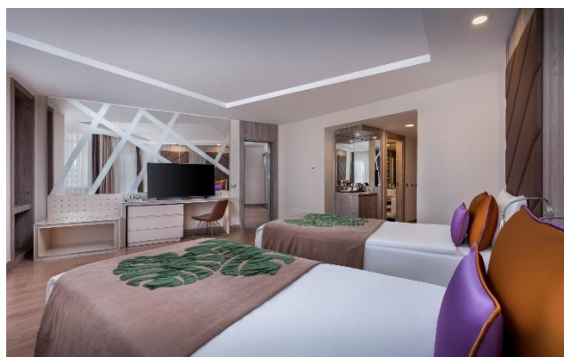
BE Family B