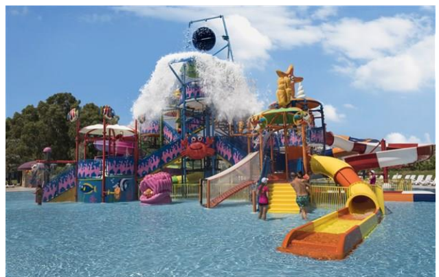
Wasserrutschen für Erwachsene und Kinder