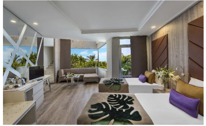
BE Family Loft

BE FAMILY A: insgesamt 110 Zimmer, jedes Familienzimmer ist 56 m 2 und besteht aus 2 Zimmer. Im Elternzimmer gibt es 1 Frenchbett, 1 Sofa, Im Kinderzimmer gibt es 2 Singlebetten (Maximale Unterkunft 4+1 oder 3+2). Die Zimmer verfügen über Balkon, 1 Dusche / WC, Klimaanlage (zentral und stundenweise), Haartrockner, Direktwahltelefon, LCD Fernsehen (Sat Empfang), Musikempfang, Safe, Minibar, Laminatboden, Wasserkocher, Tee und Kaffee. Jeden Tag Zimmerreinigung und Wechsel von Badetuch. Wechsel von Bettlaken jeden zweiten Tag einmal. Zimmerlage als seitlicher Meerblick. Schlafsofa: 160x80 cm.