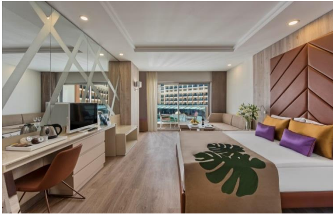
BE Family A