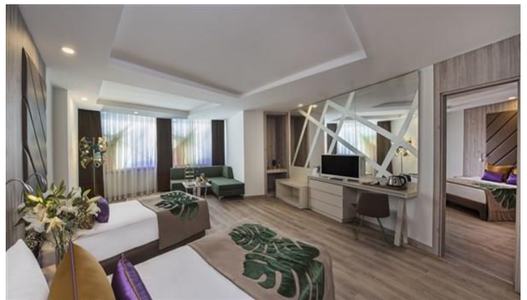
BE Family B