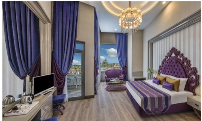
BE Delux Loft

BE ROMANTIC: insgesamt 56 Zimmer, jedes Zimmer ist 32 m 2 . In jedem Zimmer gibt es 1 Frenchbett (Unterkunft maximum 2 Erwachsene). Die Zimmer verfügen über Balkon, Dusche / WC, Klimaanlage (zentral und stundenweise), Haartrockner, Direktwahltelefon, LCD Fernsehen (Sat Empfang), Musikempfang, Safe, Minibar, Laminatboden, Wasserkocher, Tee und Kaffee. Jeden Tag Zimmerreinigung und Wechsel von Badetuch. Wechsel von Bettlaken jeden zweiten Tag einmal. Zimmerlage als Landseite oder seitlicher Meerblick.