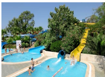
Бассейн с горками 1