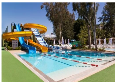
Бассейн с горками 2