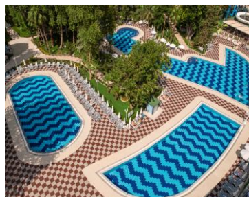
Бассейн 3, 4, 5