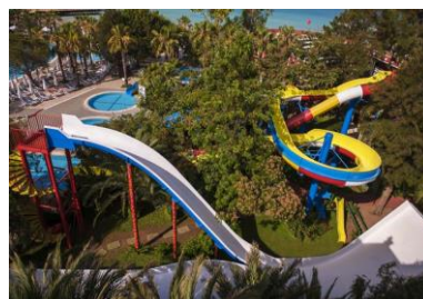
Бассейн с горками 3