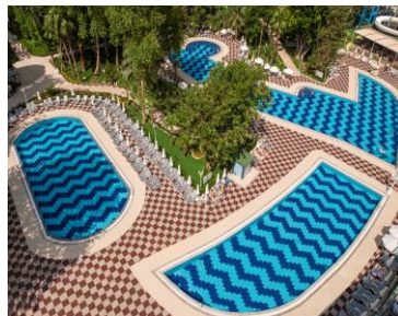
Pool 3 (oben links), 4 (Mitte), 5 (oben rechts)